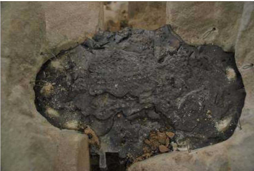
Pečat na vrhu spomenika povrh novog trna, od zalivenog olova.